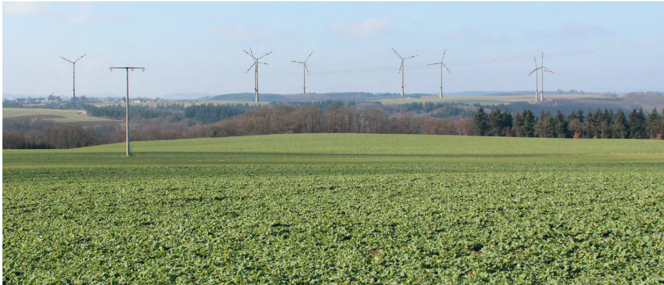
Vorher: Visualisierung des geplanten Windparks Mörzdorf, erstellt im Jahr 2013