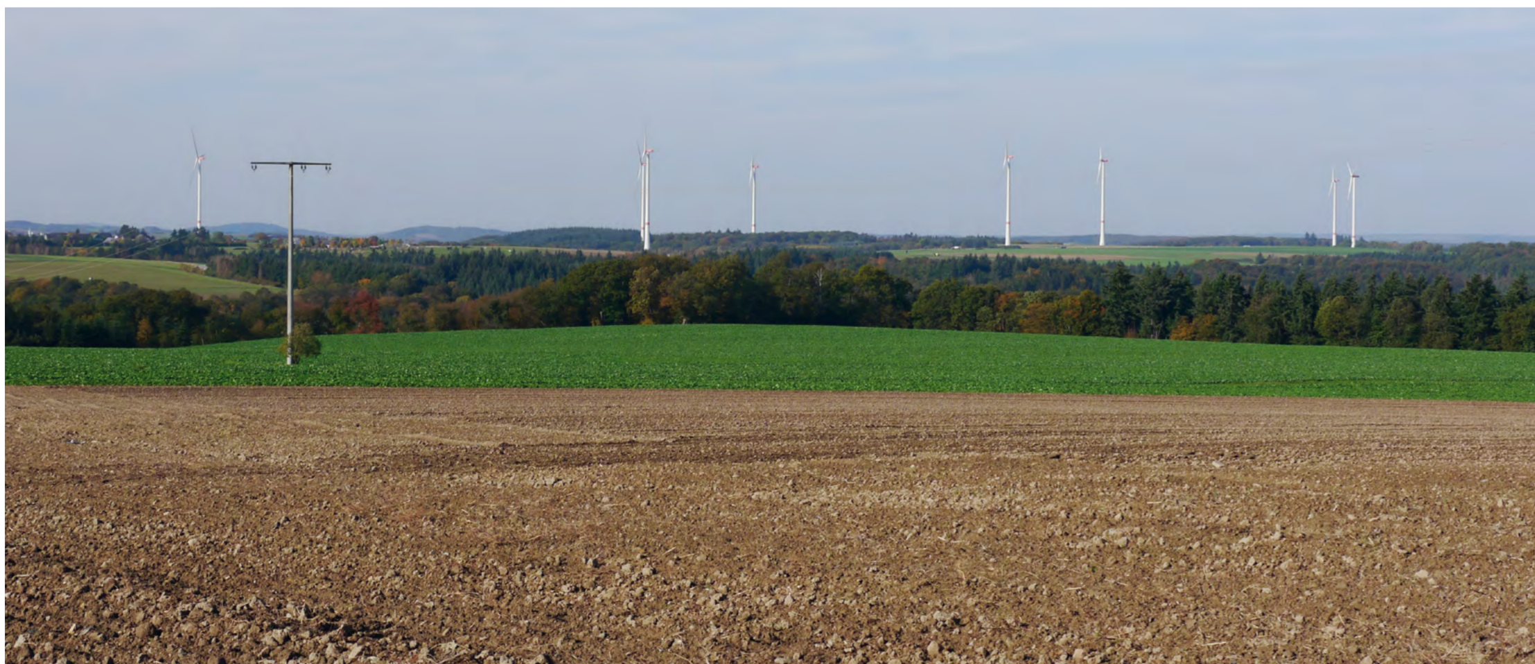
Nachher: Fotoaufnahme des errichteten Windparks, aufgenommen im Oktober 2019