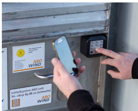
Eingabe der PIN-TAN-Kombination am Keypad

Der Betreiber dieses Windparks hat sich für die Installation des Zugangskontrollsystems ABO Lock an den Windenergieanlagen (WEA) entschieden. Mit diesem Schreiben möchten wir Ihnen einen kurzen Überblick über die Vorteile sowie die Handhabung des Systems geben.