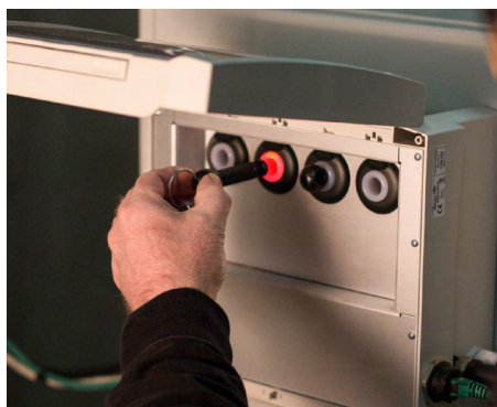
Entnahme entsprechend der Zugriffsberechtigung