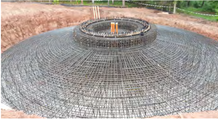
Die Bewehrung eines Fundaments wird vorbereitet. Auf dem Fundament wird der knapp 135 Meter hohe Stahlurm errichtet.