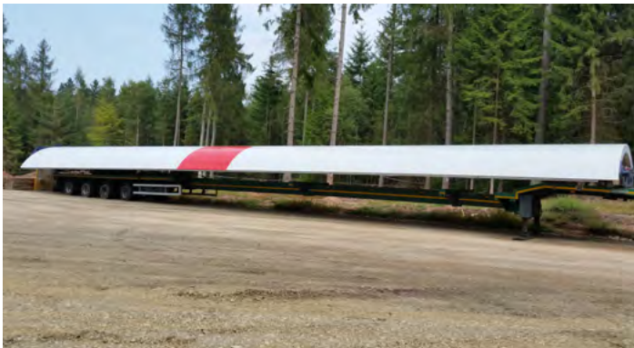
Der Stahlurm wird am Boden vormontiert und anschließend errichtet.