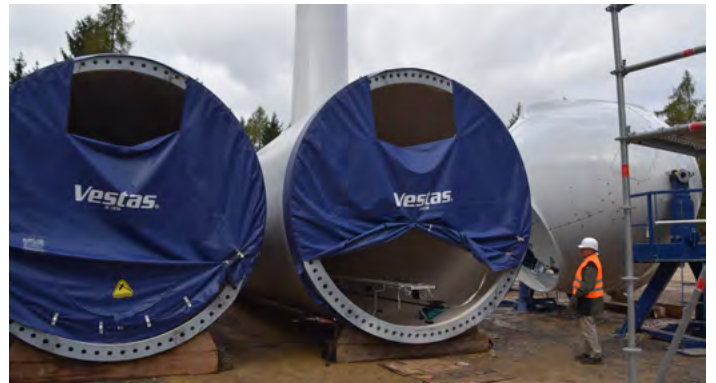
Der Anlagenhersteller Vestas hat die Turmteile angeliefert, auf der Baustelle werden sie für die Montage vorbereitet.