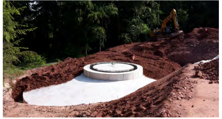
Der Beton wurde eingefüllt und der Boden anschließend wieder aufgeschüttet.