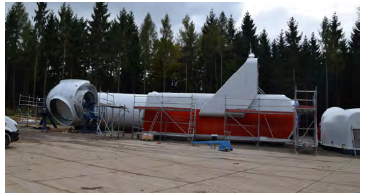
Die Nabe und das Maschinenhaus der Anlage. An die Nabe werden später nacheinander auf 137 Metern Höhe die drei Rotorblätter geschraubt.