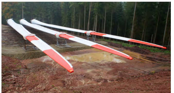
Bei Offenland-Anlagen wird der Rotor oft am Boden zusammengesetzt, im Wald spart man mit der Einzelblattmontage dagegen Rodungsflächen ein.