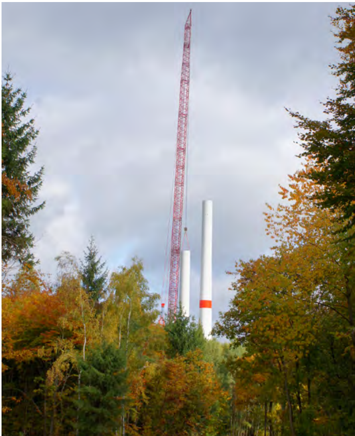
Der Kran hebt ein Turmteil auf den wachsenden Stahlurm. Dort wird es von den Monteuren aufgesetzt und verschraubt.