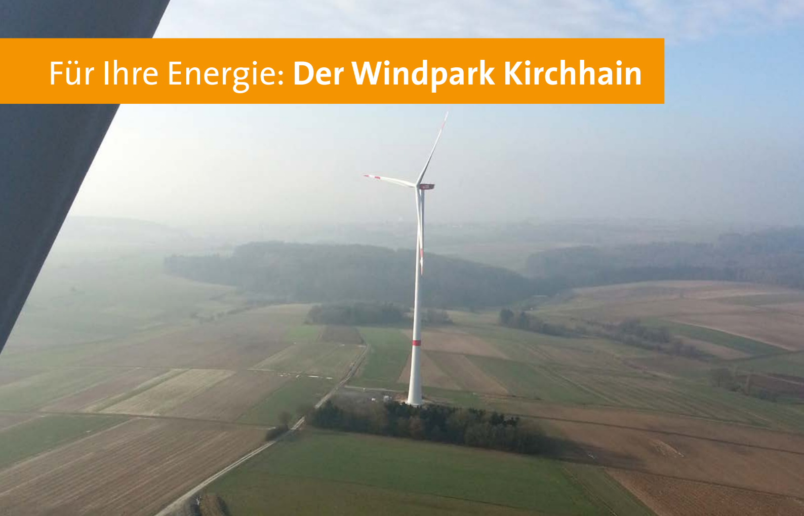
Die Windkraftanlage WEA 5 des Windparks Kirchhain

Fünf Windkraftanlagen produzieren in Kirchhain seit Februar 2014 klimafreundlichen Strom, zwei im Wald sowie drei Anlagen auf den Feldern südlich von Emsdorf. Der Wiesbadener Projektentwickler ABO Wind hat den Windpark geplant und errichtet, der Frankfurter Energieversorger Mainova und die Hamburger Beteiligungsgesellschaft CEE betreiben ihn gemeinsam.