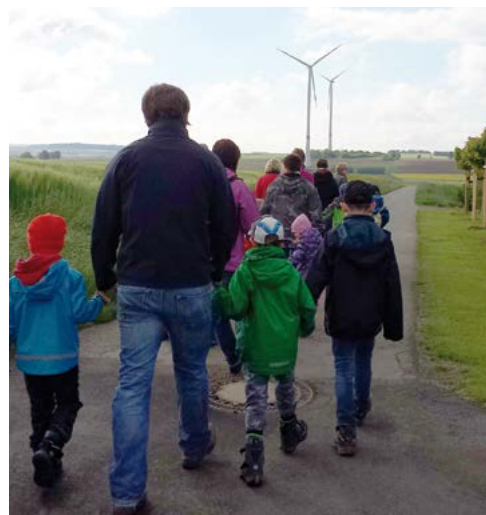
Windpark-Führung mit dem Kindergarten Emsdorf