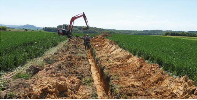
Das Kabelsystem wird entlang bestehender Wege verlegt.