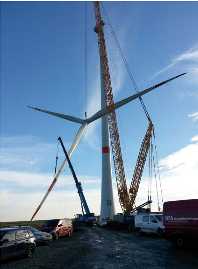
Bei den drei Anlagen im Offenland werden die Rotorblätter am Boden an die Nabe montiert und danach als „Stern gezogen“.