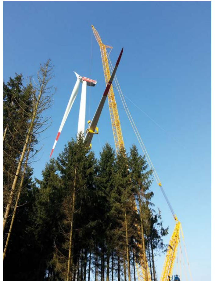
Im Wald werden die Rotorblätter einzeln an die Nabe montiert. Diese Methode ist platzsparender und reduziert den Rodungsbedarf.